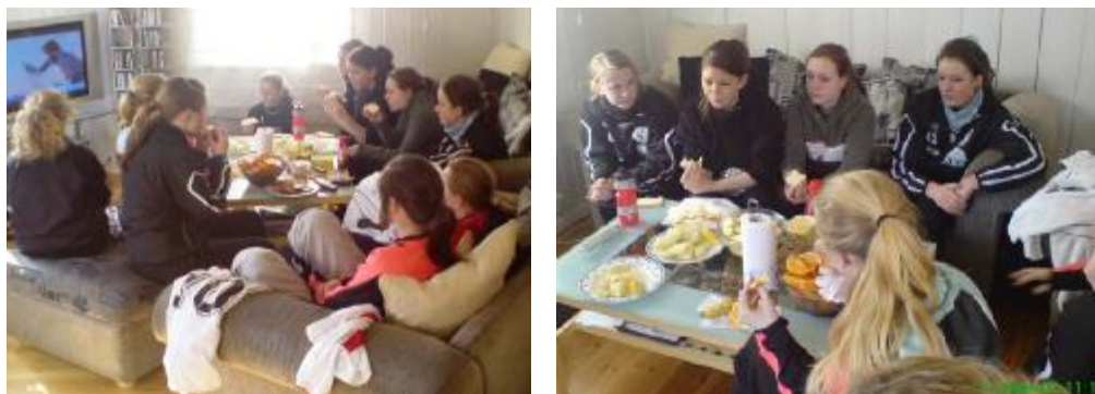
Matpause under Sting Cup

Neste turnering var Sting Cup hvor vi spilte innledende kamper lørdag 17.mars. Vi tok oss videre til sluttspillet men overbeviste ikke spillemessig. Vi kom oss utover i turneringen men ble slått ut i 8.delsfinalen mot Arna Bjørnar.