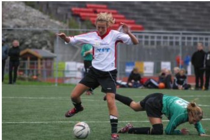
Hordabø nede for telling

ENK var preget av høye skuldre og stresset unødvendig mye når vi hadde ballen. Vi hadde før kampen påpekt muligheten for raske overganger og viktigheten av å spille fri kantene. Dette fikk vi ikke til og slet med å finne ro og rytme i spillet vårt. Etter 20 minutters spill fikk Hordabø straffespark etter at dommeren hadde sett en liten dytt eller noe innenfor 16-meteren. Riktig eller ikke, det bryr gjestene seg lite om og setter ballen i mål. Vi kom mye mer inn i kampen etter dette og skapte noen muligheter vi vanligvis setter men resultatet 0-1 sto seg til pause.