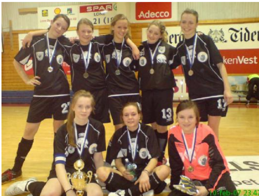
Samarbeidslaget NBK/Kvernbit Jenter Elite med sin første pokal

Jentelaget deltok i innendørsturneringen Arna Bjørnar Cup i februar. Etter mye bra spill på en og to touch feide jentene ut lag etter lag før Gneist ble motstander i finalen. Etter en forrykende forestilling trakk jentene fra Liland det lengste strået og vant 6-5. Det var første turneringen for samarbeidslaget og det var gøy og se tidligere konkurrenter sloss om et felles mål. Dette lovet godt for fortsettelsen.