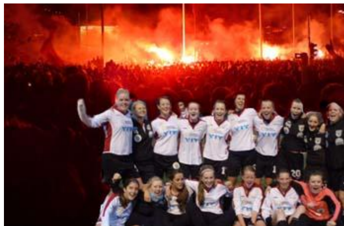
Jubel etter å ha nådd målet om opprykk til 3.divisjon